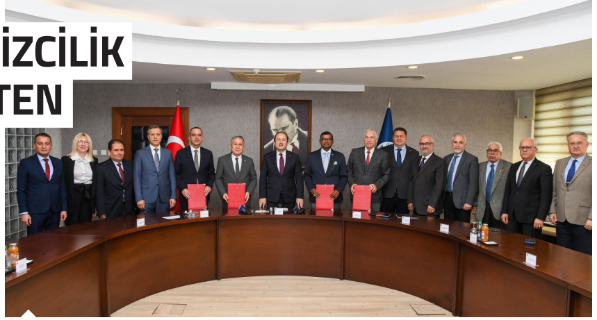
Mersin Uluslararası Liman İşletmeciliği A.Ş., Denizcilik Fakültesi'ne köprü üstü simülatörü, ECDISS, GMDSS, makine ve yük elleçleme simülatörü gibi son teknoloji ekipmanlar bağışlayarak öğrencilerin modern eğitim olanaklarına erişimini sağlayacak.