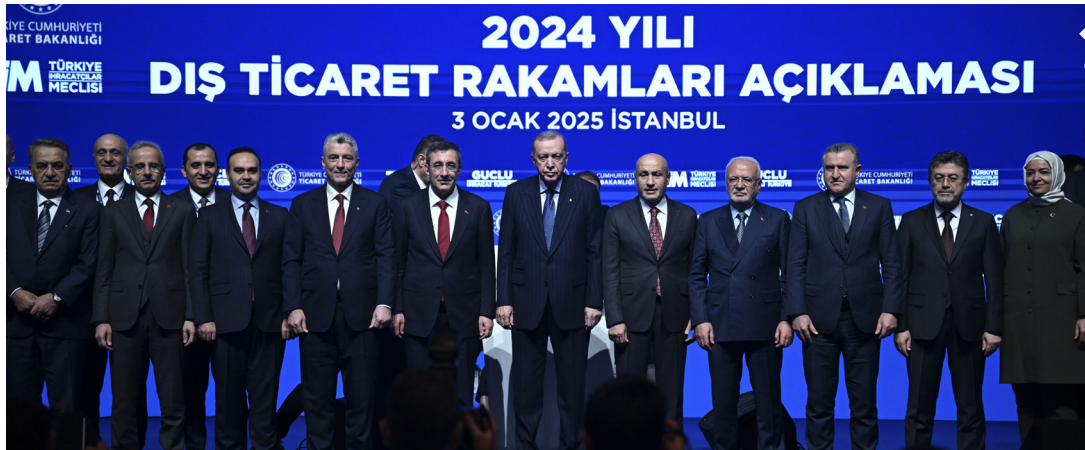
Cumhurbaşkanı Erdoğan, beraberindeki bakanlar ve ihracatın kurmaylarıyla birlikte aile fotoğrafı çekti.

2025 senesinde nispeten daha iyi bir yıl beklendiğini, yeni dönemde küresel iktisadi faaliyetin toparlanmakla birlikte salgın öncesi ortalamalarının altında seyredeceğinin anlaşıldığını vurgulayan Cumhurbaşkanı Erdoğan, OECD'nin tahminlerine göre dünya ekonomisinin 2024 yılını yüzde 3,2'lik büyümeyle kapatacağının, 2025 yılında ise yüzde 3,3'lük bir büyüme oranına ulaşacağını öngörüldüğüne değindi.