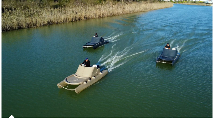
Polietilen tekneler; dayanıklılık, hafiflik, düşük bakım maliyeti, korozyon ve UV ışınlarına direnç gibi özellikleriyle kullanıcılarına uzun ömürlü ve ekonomik kullanım avantajları sunuyor.

Portföylerine 2 yeni tekne modeli eklemeyi planladıklarını belirten Avunduk, "Avrupa'daki teknolojik gelişmeler ışığında metal ve kalıp atölyemizi yenileyeceğiz. Daha uygun fiyatlı ve yüksek kalite kalıplar imal ederek kendi ürün portföyümüzdeki ürünleri geliştirmeyi ve özellikle Avrupa firmaların taleplerine cevap veren