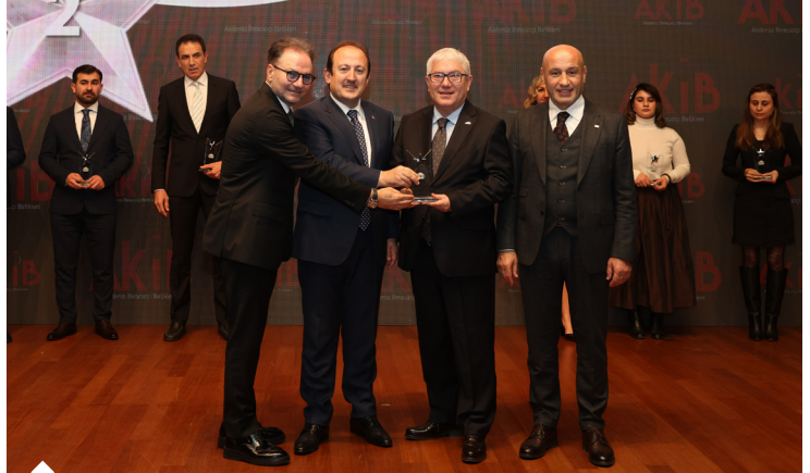
AHKİB üyeleri arasında 2023 yılında en fazla ihracat yapan ikinci firma Birgi Birleşik Giyim oldu.

Teknolojinin ve internetin günlük yaşamı, iş dünyasını ve toplumsal yapıyı dönüştürdüğü, dijital